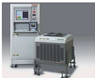
SoCテスタ T6575 ウェハプローバ P-12XL