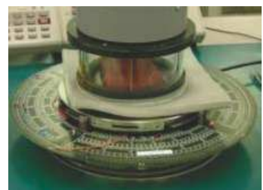
温度印加測定 (-55°C~+150°C) T2500