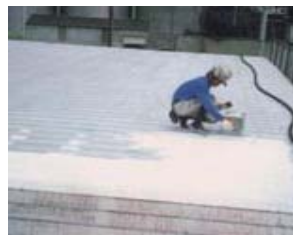
■ 断熱による省エネ 最先端のセラミック技術を用いた工場・倉庫屋根/外壁遮熱