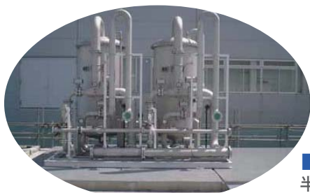
■ 純水製造装置 半導体製造等で使用する超純水製造装置